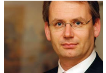
Landesrat Michl Laimer